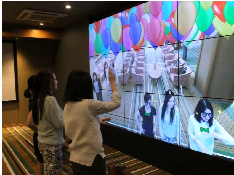
<9面マルチディスプレイシステム(PN-V601A×9台)>

年間約12万人が宿泊されるHOTEL天坊様は、常に時代のニーズに応え、心のもったサービスをご提供されています。フロント前の広々としたロビーラウンジには、日本庭園を臨める足湯やシャープ製インフォメーションディスプレイPN-V601Aを利用した9面マルチディスプレイシステムなどを備え、静と動をバランス良く組み合わせ、さまざまな年齢層のお客様に快適にお過ごし頂けるようおもてなしをされています。9面マルチディスプレイシステムは、コンテンツ配信表示システム(e-Signage)を利用し、時間帯に合わせ伊香保温泉をはじめとする近隣の観光名所の紹介やホテル館内のご案内を配信表示。さらに、来客層にあわせ、パブリックビューイングやAR技術を利用したアミューズメントソフト(7種類)のアトラクションに切り替えて迫力ある大画面に表示するきめ細やかな対応で、顧客サービスの向上に活用されています。