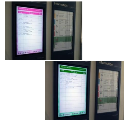
スカイタウンホール・スカイタウンギャラリーで開催予定のイベントを表示。

成田市教育委員会 生涯学習課様では、芸術や文化振興の活動を推進するために、成田市民の文化・芸術活動の場として、あらたに文化芸術センターをオープン・運営することになりました。センターが建物の3階以上になることから、人の動線を考慮して、施設の認知度のアップとセンターへの誘導を目的に、各階のエントランスを中心にデジタルサイネージシステムの導入を検討。デジタルサイネージシステムは、市内の他の施設でも導入している実績から、細かな文字情報を鮮明に表示する高画質・高精細の大画面、また、担当者が変更になっても誰もが簡単操作でコンテンツやレイアウト情報などの配信・表示をコントロールしやすいサイネージソフトウェアの使い勝手を重視され、シャープのインフォメーションディスプレイ(PN-E602)とコンテンツ配信表示システム「e-Signage(イーサイン)」を採用されました。さらに、表組みなどの文字情報が主体の表示コンテンツの作成・配信を大幅に効率化する「e-Signageプラス」を合わせて導入されました。