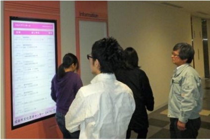
スカイタウン成田 1階 インフォメーションディスプレイ(PN-E602)

2015年7月にオープンした千葉県成田市の教育委員会生涯学習課様が運営する成田市文化芸術センターは、JR成田駅徒歩1分という好立地にあるスカイタウン成田の3~5階にあります。可動式の舞台・座席や豊富な舞台設備を備えた多目的ホールやさまざまな展示が可能な5つのギャラリー、主要な楽器を揃えた防音仕様の音楽室など、多彩な施設を備え、成田市民の文化・芸術活動の場として利用されています。