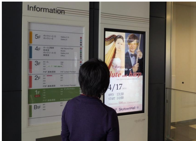
スカイタウン成田 1階 エントランス インフォメーションディスプレイ(PN-E602)

シャープ製のインフォメーションディスプレイ(PN-E602)は、成田市文化芸術センターの施設案内のデジタルサイネージとして、スカイタウン成田の5カ所に導入されています。高画質・高精細の大型ディスプレイには、表組みデジタルサイネージ用ソフトe-Signage(イーサイネージ)プラスを利用し、成田市民へのセンターの紹介と開催イベントの案内や集客に活躍しています。