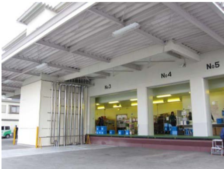
【尾山台配送センター】