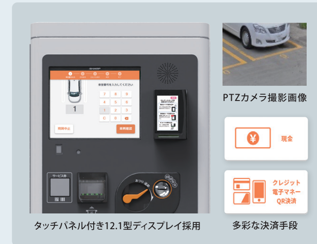
タッチパネル付き12.1型ディスプレイ採用

セルフ方式のガソリンスタンドなどで豊富な実績のある当社POSの技術を使用。屋外でも見やすく使いやすいタッチパネル付き12.1型ディスプレイを搭載。多彩な支払い手段*1や、サービス券*2にも対応。