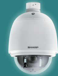
ネットワークカメラ