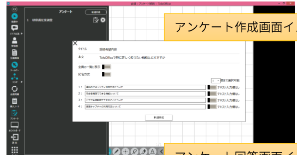
アンケート作成画面イメージ