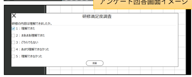
アンケート回答画面イメージ